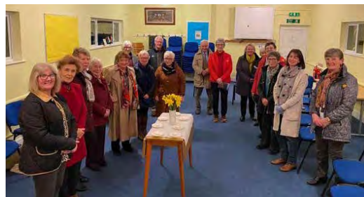
Cana, Bancyfelin, Sir Gaerfyrddin