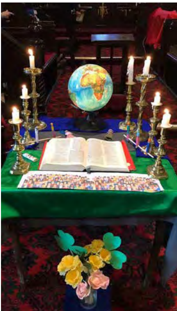
Y bwrdd wedi ei osod yn y gwasanaeth Cymraeg yn Eglwys Mechell, Cemaes, Môn.