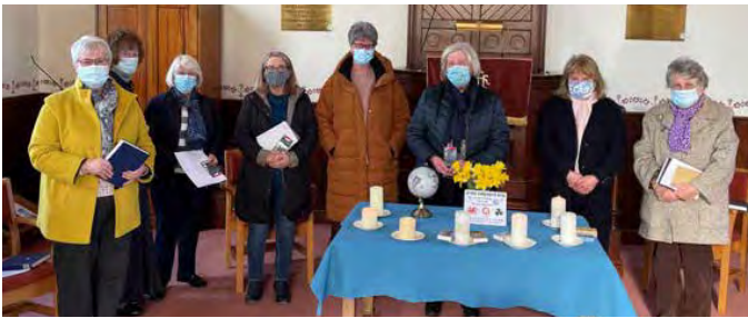
Y rhai gymerodd ran yn y gwasanaeth dwyieithog yn Soar, Nercwys