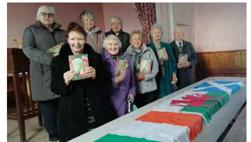
Capel Brynmoriah, Brynhoffnant