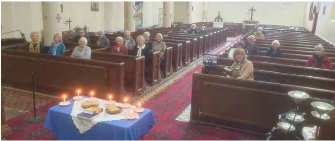
Oedfa undebol hybrid yn Eglwys Crist, Caerfyrddin