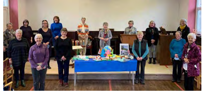
Recordio'r gwasanaeth yn Llanuwchllyn