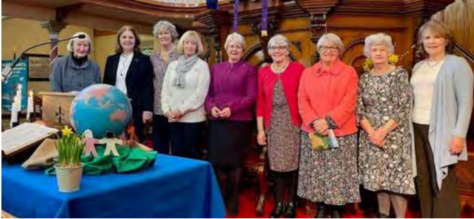
Gwasanaeth undebol eglwysi Cymraeg Caerdydd yn y Tabernacl

ac roedd llawer iawn o'r byrddau a baratowyd fel ffocws ar gyfer y gwasanaeth yn cynnwys llieniau glas a chennin Pedr, sef lliwiau baner Wcráin. Dyma rai lluniau o fannau gwahanol yng Nghymru a fu'n cynnal y gwasanaeth arbennig hwn yn ystod penwythnos cyntaf Mawrth eleni.