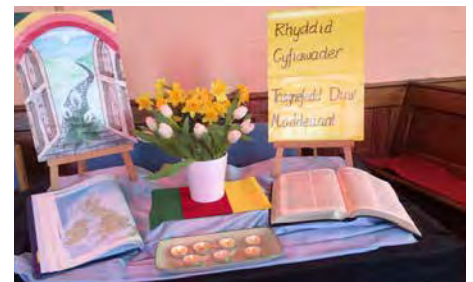
Y bwrdd wedi ei hulo'n barod yn Seion, Capel Seion ger Aberystwyth