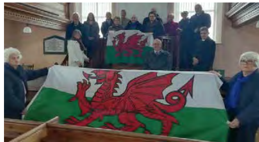
Capel Bryngwenith, Henllan, Castellnewydd Emlyn