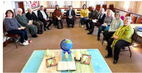
Capel Hermon, Cynwil, Sir Gâr