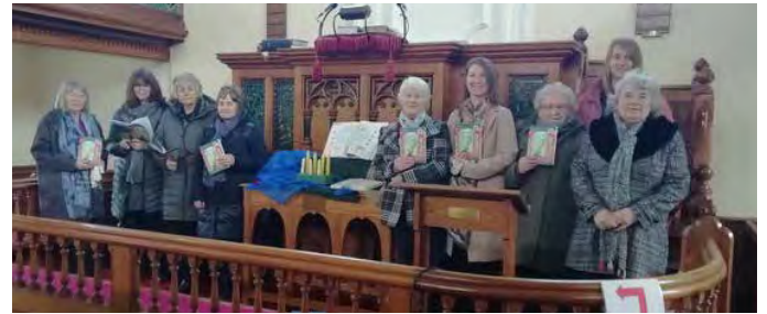
Capel Pisgah, Talgarreg