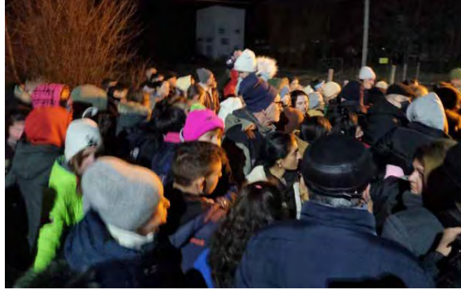
Mae miloedd o ffoaduriaid ar draws Wcráin yn ceisio lloches mewn gwledydd eraill.

Mae'r partner – Hungarian Interchurch Aid – eisoes wedi anfon 28 tunnell (gwerth 400,000 ewro) o nwyddau, yn cynnwys bwyd a dŵr. Mae HIA wedi bod yn gweithio yn Wcráin am 25 mlynedd ac yn fwyaf diweddar wedi bod yn helpu gydag ymateb i'r pandemig.