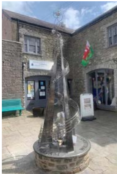
Cofeb newydd Pantycelyn

'Mae'n gwbl briodol felly, o'r diwedd, fod gennym gerflun teilwng i ddatlu statws William Williams, Pantycelyn, yma yn ein tref. Mae wedi bod yn daith chwe blynedd, a ddechreuodd yn 2017 yn ystod blwyddyn dathlu 300 mlynedd ers geni William Williams, Pantycelyn, pan fu rhywfaint o brotest gan ymwelwyr wrth iddynt geisio ymweld â bedd y gŵr mawr.'