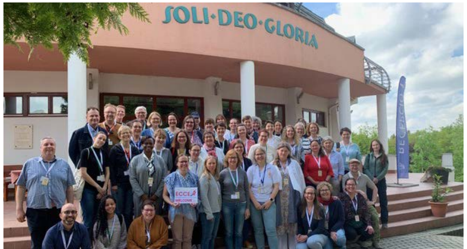
Y rhai fynychodd y gynhadledd