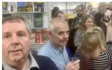
Nifer o gyhoeddwy'r Cymreig yn cyfarfod ar stondin Cyhoeddi Cymru yn y Ffair Lyfrau yn Llundain

Wrth baratoi ar gyfer y gynhadledd yn Hwngari, yr un neges oedd cynrychiolwyr y gwledydd, sef bod yna argyfwng ym maes gwaith plant, a bod angen aildanio'r gwaith ar fyrder. Ond mae'n waith heriol ar y gorau, ac ar adegau yn unig iawn – a dyna werth cydgyfarfod ag eraill bob amser, i ysbrydoli a chalonogi. A dyna'r hyn a brofais innau dros y mis a aeth heibio.