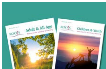
Y ddau gylchgrawn a gyhoeddir gan Roots bob deufis

Wedi dychwelyd o Hwngari, daeth yn amser gosod stondin yn Eisteddfod yr Urdd yn Llanymddyfri, a threulio wythnos yno'n cyfarfod cannoedd o blant ac arweinwyr, yn weinidogion, athrawon ysgol Sul ac athrawon ysgol. Braff oedd cael ein hatgoffa o chwilfrydedd ysbrydol y plant, gan dynnu sylw unwaith eto at bwysigrwydd cynnig cyfleoedd iddynt drafod y ffydd. Ond cafwyd nifer o sgysiau gan arweinwyr hefyd yn digalonni wrth adrodd nad oes gwaith plant yn eu cylch, a bod y plant wedi diflannu. Efallai eu bod yn anweledig, ond maent yn dal yno, a cheisiwyd annog pawb i feddwl yn greadigol am yr hyn sy'n bosib. Ac fel y bu i'r gwirfoddolwyr o'r eglwysi lleol ymuno â ni i fod ar faes Eisteddfod yr Urdd, efallai y gallwn ninnau hefyd fod yn 'halen a goleuni' wrth ymuno â gweithgareddau'r Urdd neu'r Ffermwyr Ifanc yn ein cymunedau lleol.