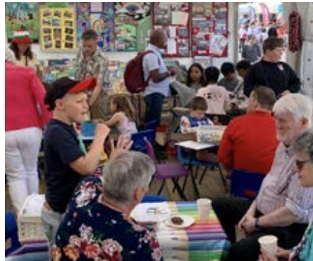
Criw o blant yn mwynhau ar stondin yr Eglwysi yn Eisteddfod yr Urdd

Erbyn hyn mae 'na gyfoeth o adnoddau ar gael ar gyfer cynnal ysgolion Sul, clybiau plant ac ieuentid, addoliad teuluol creadigol a gwaith ysgolion. Bu rhai'n cwestiynu gwerth datblygu adnoddau fel Llan Llanast , Chwarae a Chredu a Roots , yn wyneb y nifer bychan o ddefnyddwyr. Onid oes angen edrych ar hyn o gyfeiriad gwahanol, a meddwl sut gallwnnigynyddu'r defnydd o'r adnoddau gwerthfawr hyn? Yr her i ni ar hyn o bryd yw defnyddio'r adnoddau hyn er mwyn cyfoethogi profiad plant yn ein gweithgaredd eglwysig. Mae angen adnoddau creadigol a chyfoes arnom o hyd, o wefannau sy'n cynnwys adnoddau digidol a chaneuon Cristnogol cyfoes i adnoddau lliwgar i'w rhoi yn nwylo ein plant.