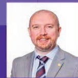
Mabon ap Gwynfor AS