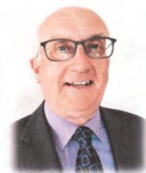
Capel Bryn Iwan,

yn weinidog i Iesu Crist yn Eglwys Annibynnol Bryn Iwan, Blaen-y-coed, Nanteris a Moriah, Blaen-waun