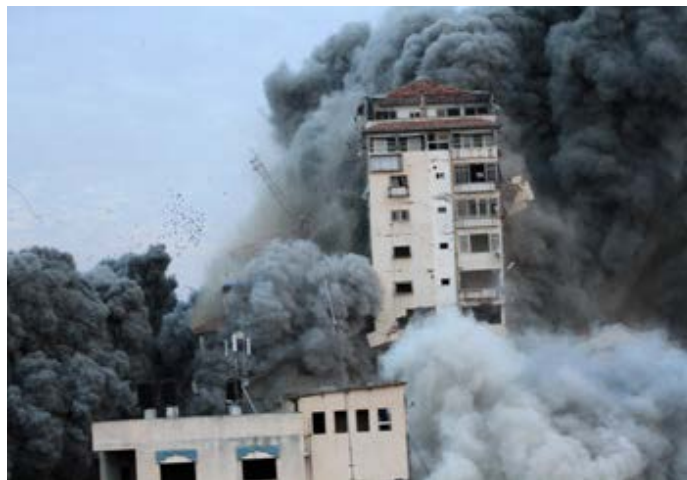
Llun: Palestinian News & Information Agency (Wafal) in contract with APImages, CC BY-SA 3.0

Dyma ddetholiad o weddiâu y gallwn ni eu defnyddio, boed ar y Sul neu'n ddyddiol ar ein haelwydydd: