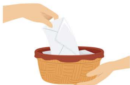
Casgliad eglwys arbennig bob mis