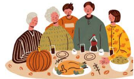
Swper cylch i wahoddedigion