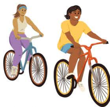
Sesiynau seiclo noddedig