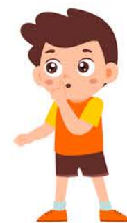
Distawrwydd wedi'i noddi