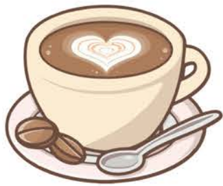
Bore coffi / Noson Goffi