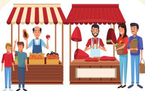
Fiesta (ffair) aeaf/wanwyn/haf/ Nadolig