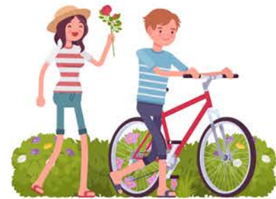
Taith gerdded natur