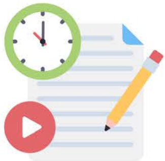
Noswaith cyrri a chwis