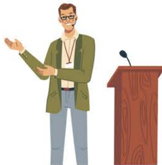
Darlith ar bwnc penodol