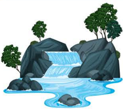
Taith i ymweld â ffynhonnau lleol